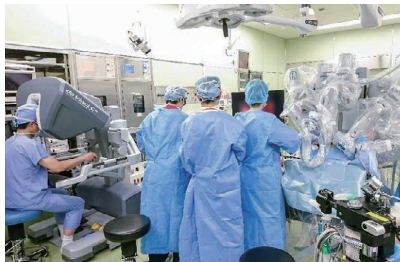
手術支援ロボット

手術支援ロボット、高精度リニアック等の高度医療器械を用いた治療方法が、標準化、一般化。